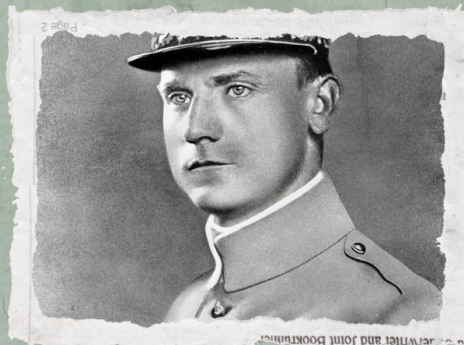
Milan Rastislav Štefánik